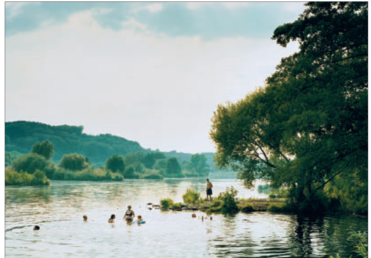
„Heimat, # 25“, 2004