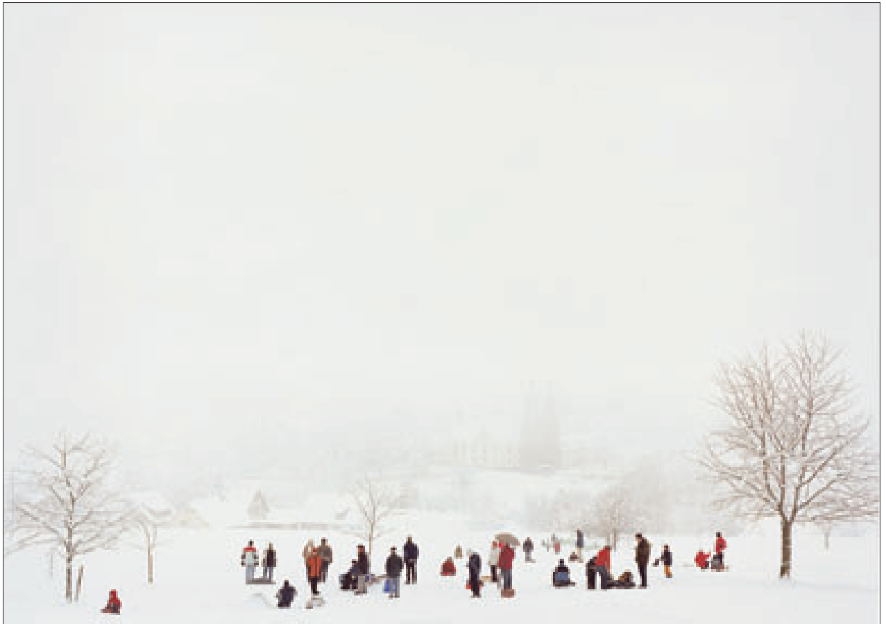
„Heimat, # 31“, 2004