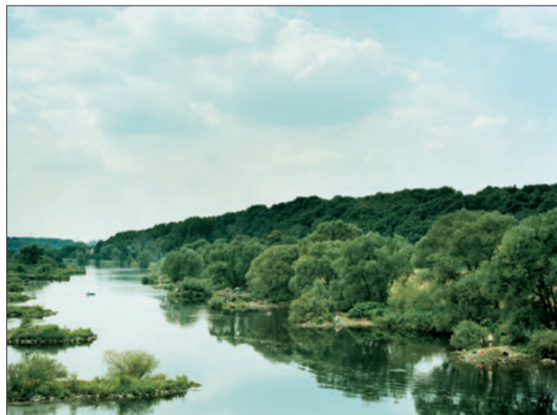
„Heimat, # 24“, 2004

Ich bin immer in den Süden gefahren, im Urlaub. Später habe ich den Südosten fotografiert, Indien, Nepal, Burma, Thailand und dann die Megastädte der asiatischen Tigerstaaten. Da traute ich mich, meiner Faszination Ausdruck zu verleihen, zu erzählen, ja auch Dinge schön zu finden.