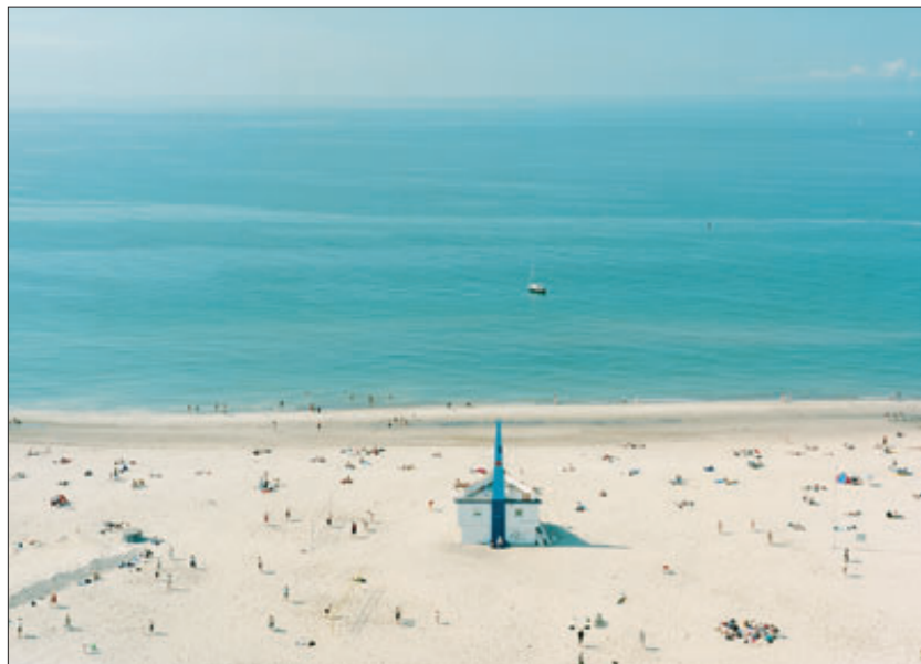
„Heimat, # 17“, 2003

mehr geprägt als Anselm Kiefer. Und „Der Mönch am Meer“ ist für mich die Quintessenz bildnerischer Übersetzung der deutschen Seelenlandschaft. Depressiv und ungeheuer hoffnungsvoll.