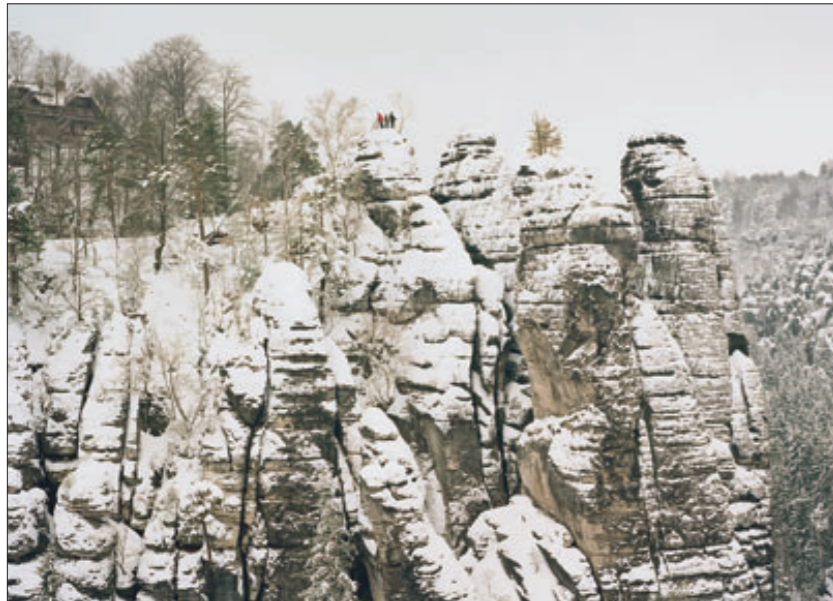
„Heimat, # 13“, 2005