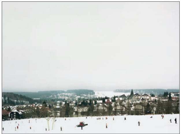
„Heimat, # 8“, 2003

Abbildungen: „Heimat“, C-Prints 2002–2005, 120 x 160 cm und 75 x 97 cm