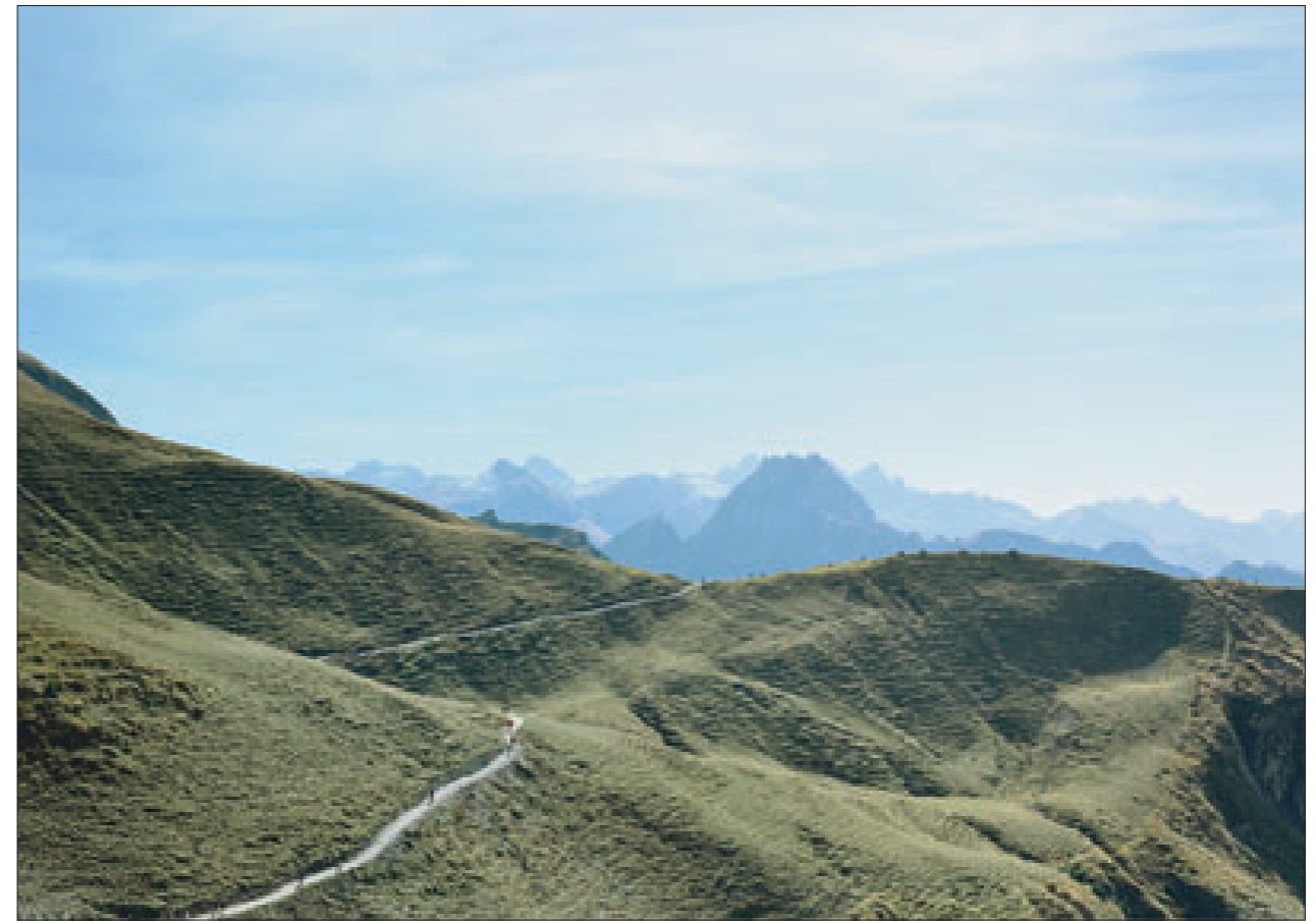
„Heimat, # 19“, 2003